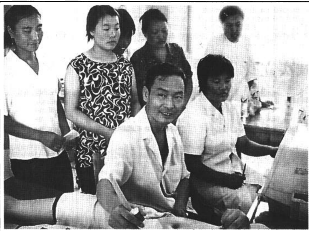
为让育龄妇女在家门口就能得到优质的生殖保健服务，东营区辛店街道计生服务站联合区计生局技术人员携带B超机、红外线乳腺诊断治疗仪及部分常用药，到茶楼村开展了优质服务上门服务...