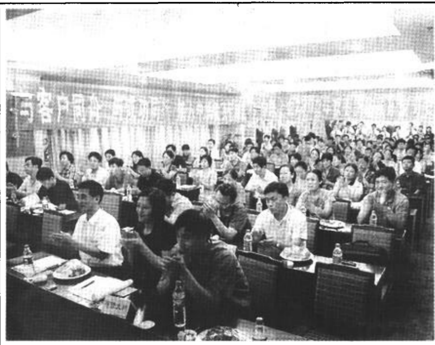
8月26日，“中兴企业2002年秋冬新品发布暨订货会”在新悦大酒店举行。会上来自北京、天津、青岛、烟台、威海、日照、临沂、德州、聊城、菏泽等市的代表和技术监督局、消费者协会、市各商业团体及代理商近200人参加了发布会...