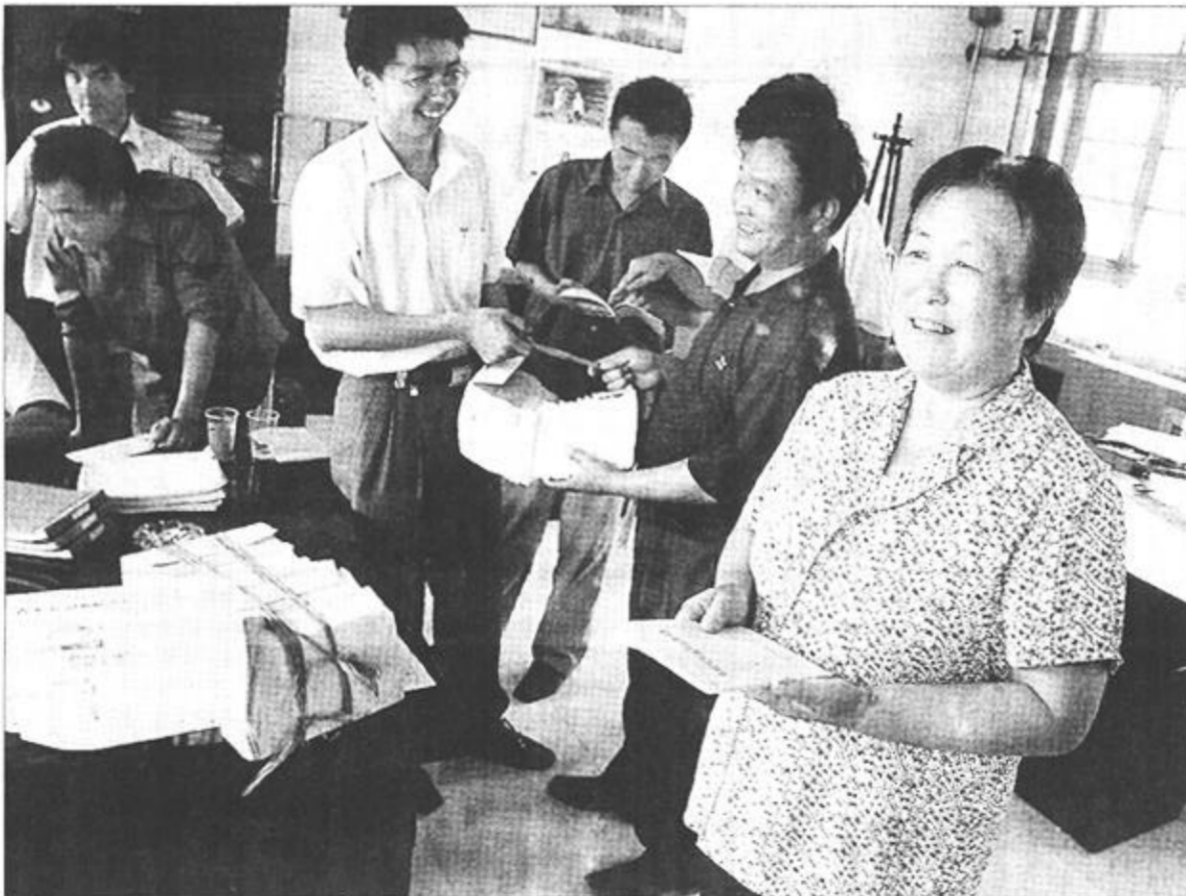
广饶县稻庄镇积极开展“法德结合，治村理家，文明诚信，强村富民”活动，有效推动全镇两个文明建设。图为镇机关干部正在为群众发放法律教育书籍。